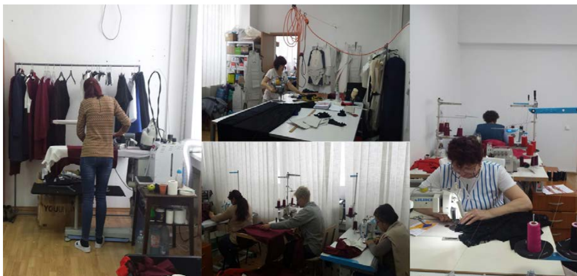
Aspecte din cadrul activitatii firmei incubate SC JIGSAW MANUFACTURING SRL

Activitatea « ITA TEXCONF » se va axa pe urmatoarele directii: